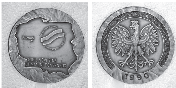
Fot. 2. Medal Odrodzenia Samorządu Terytorialnego w Rzeczypospolitej Polskiej (NIHIL NOVI SINE COMMUNI CONSENSUS – z łac. „nic nowego bez zgody ogółu”)

Zadania realizowane przez tenże Ośrodek miały zarówno wymiar ogólnoresortowy, jak i regionalny (województki). Statutowy zakres zadań Ośrodka obejmował bowiem prowadzenie prac badawczych i rozwojowych w zakresie statystyki regionalnej, a przede wszystkim: